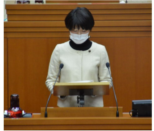
本会議一般質問(2月15日)